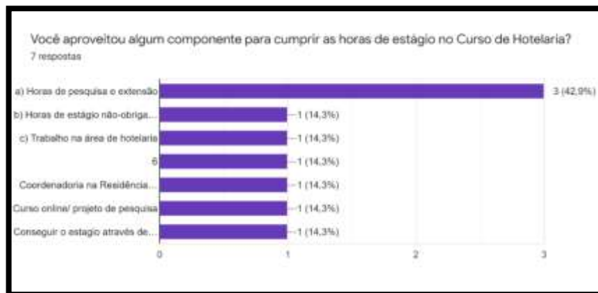
Gráfico 2 – Sobre aproveitamento de atividades complementares para cumprir horas de estágio.

Como se pode ler no gráfico a seguir isto de fato está ocorrendo, tanto os discentes como os docentes estão se adaptando e ao mesmo tempo buscando, explorando novos caminhos no processo de ensino e aprendizagem e no estágio não é diferente. Pois, para Ghedin et al (2015) o estágio é um campo de conhecimento em que estudos podem dar um novo sentido e um novo significado à prática, contribuindo efetivamente na formação do futuro profissional de hotelaria. Como se vê o percurso desenvolvido na proposta de estágio supervisionado obrigatório no modelo remoto é diverso, cuja preocupação é preparar futuros bacharéis em hotelaria que dialoguem com mercado de trabalho, mas também com a pesquisa e extensão.