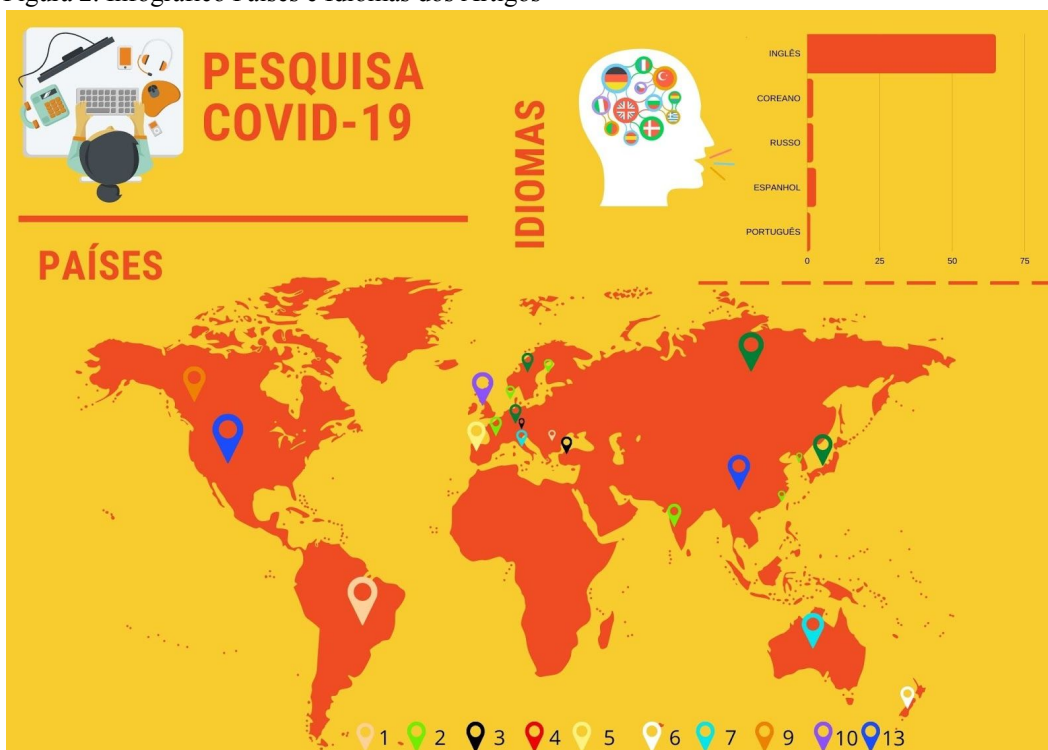
Figura 2. Infográfico Países e Idiomas dos Artigos